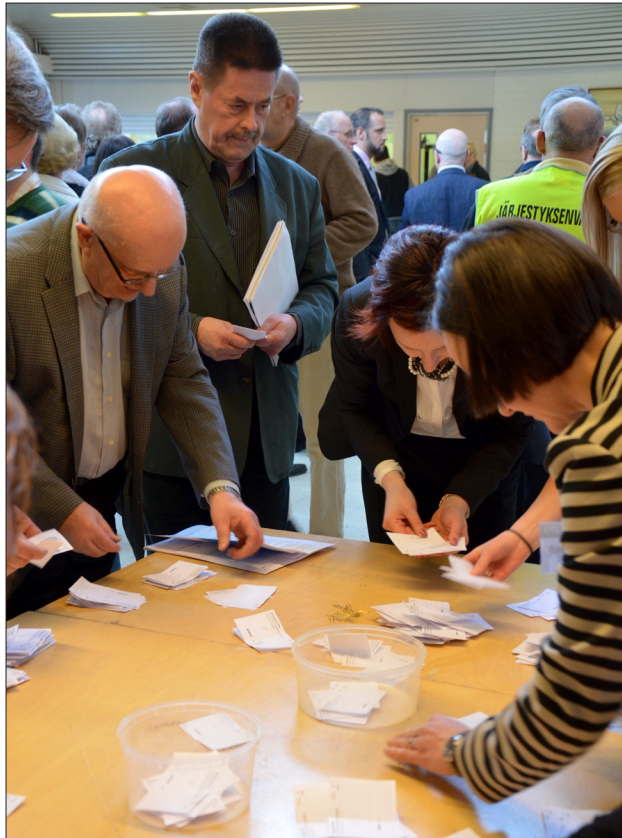
PPO:n osuuskuntakokouksessa viime vuoden huhtikuussa laskettiin ääniä muun muassa vastuuvapautta koskevassa äänestyksessä.

-Välimesoikeus ratkaisi riitauttajien esiin nostamat asiat yksimielisesti Osuuskunta PPO:n hyväksi. Kaikki kantajien vaatimukset hylättiin, mutta oikeudenkäyntikulut puolitettiin ilmeisesti kohtuusyistä, koska vastakain olivat varakas osuus-